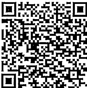
QR code แบบฟอร์มใบสมัคร