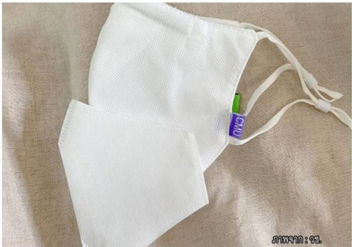
ภาพจากอีจัน