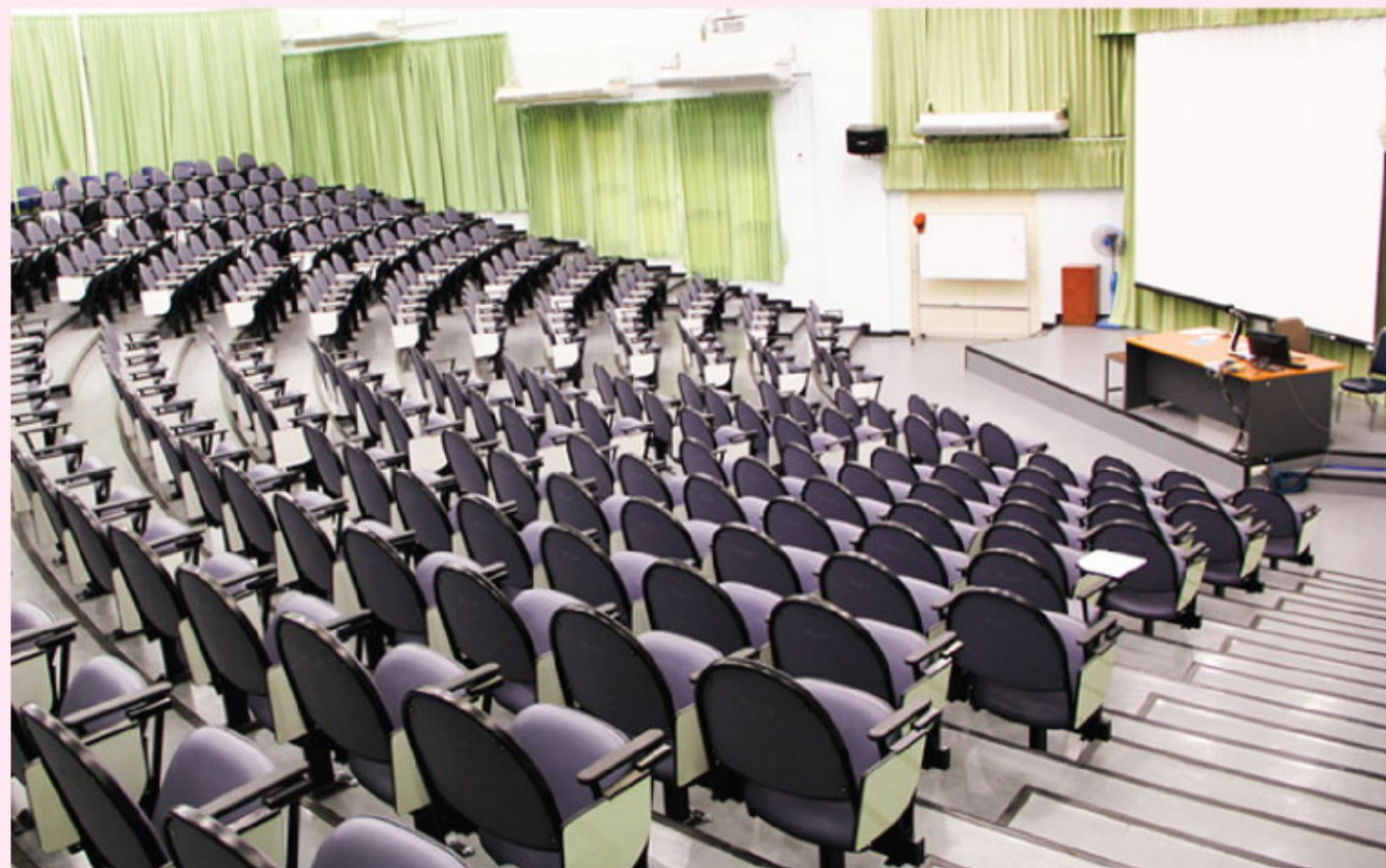
ห้องบรรยาย SCB1100 อาคาร 30 ปี คณะวิทยาศาสตร์