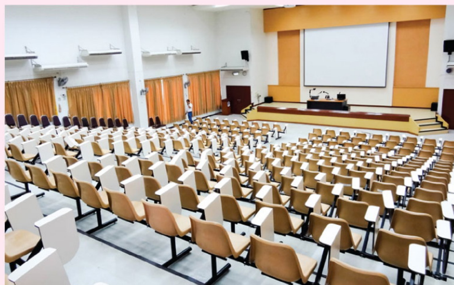
ห้องบรรยาย SCB2100 อาคาร 40 ปี คณะวิทยาศาสตร์