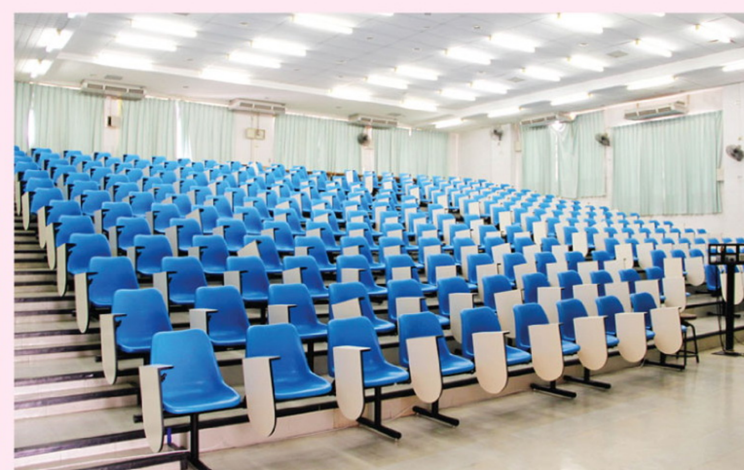
ห้องบรรยาย SCB3100 อาคารเรียนรวมและปฏิบัติการคณะวิทยาศาสตร์ 3