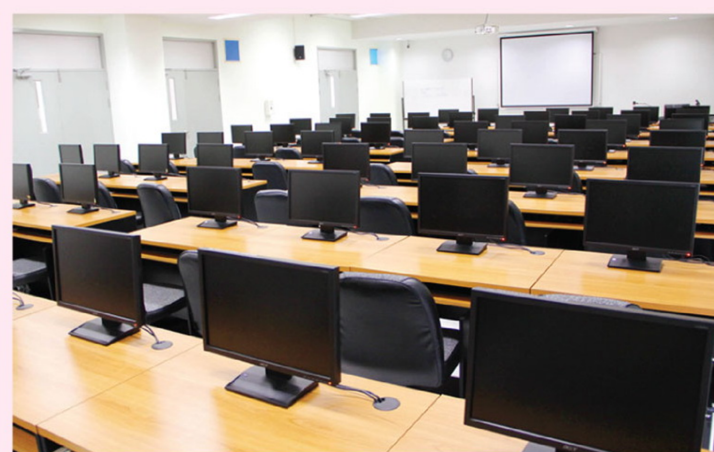
ห้องบรรยายและห้องปฏิบัติการคอมพิวเตอร์ อาคาร 45 ปี คณะวิทยาศาสตร์