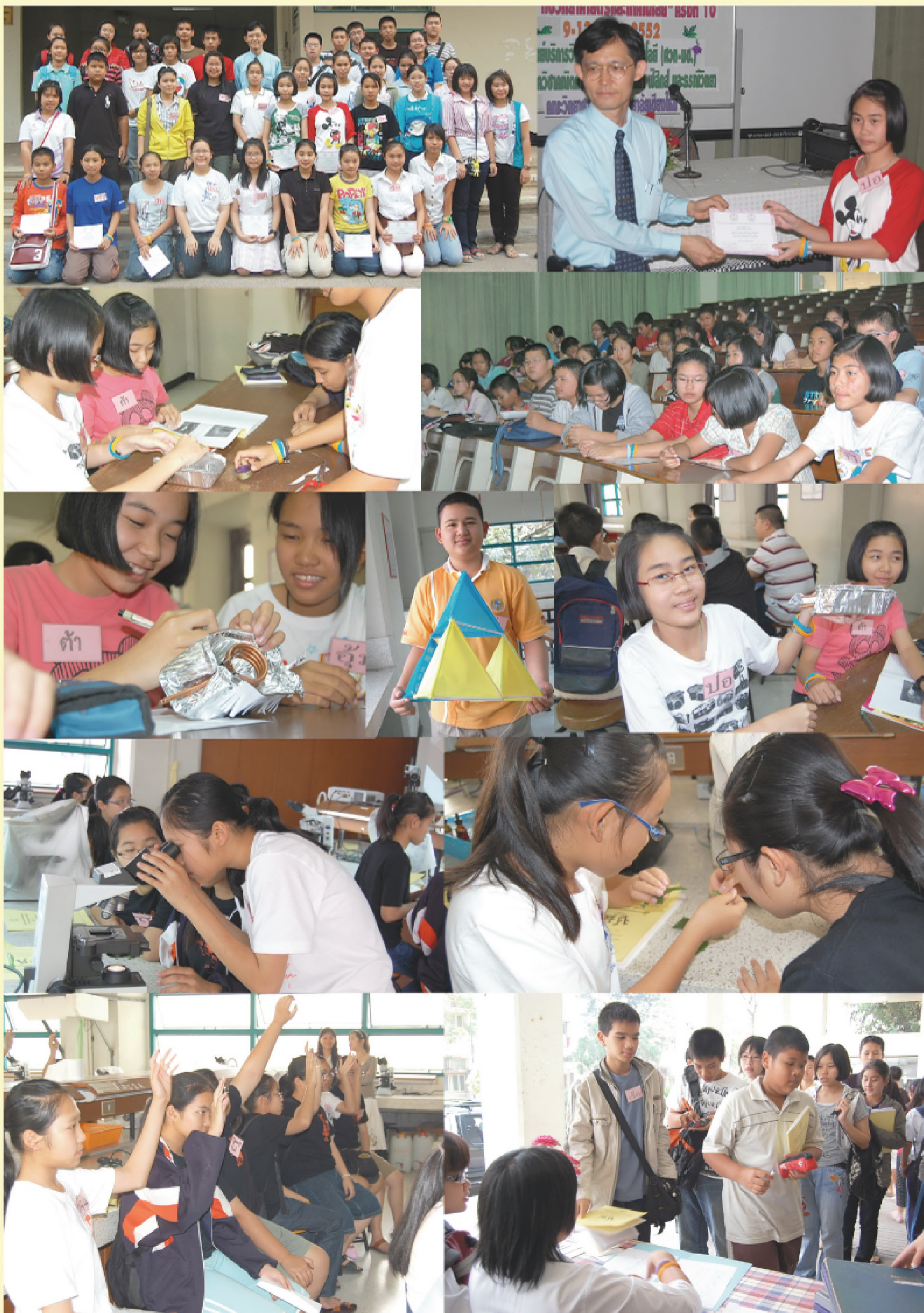
ประมวลภาพ“ค่าย 5 วันกับวิทยาศาสตร์และเทคโนโลยี” โดย ศูนย์บริการวิทยาศาสตร์และเทคโนโลยี คณะวิทยาศาสตร์ มช. ระหว่างวันที่ 9-13 มีนาคม 2552 ณ คณะวิทยาศาสตร์ มหาวิทยาลัยเชียงใหม่